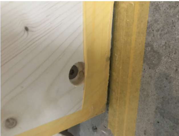
Anschluss Holzterrasse an Beton