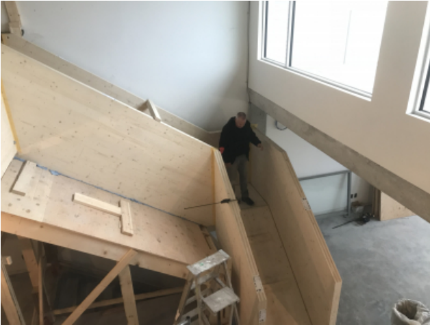
Montage der Treppe mittels Verbindungsmittel und Gerüst