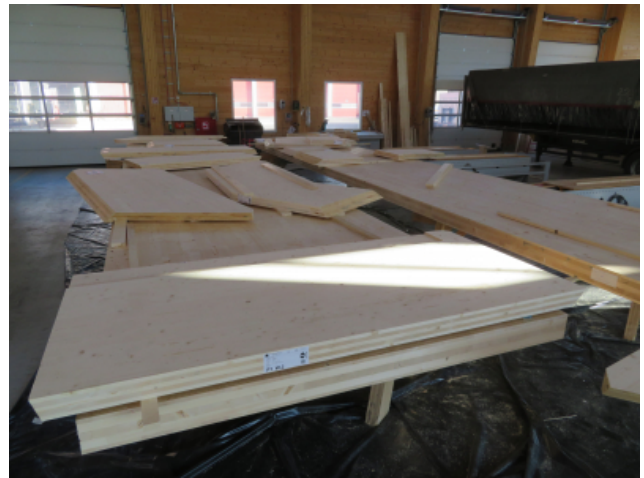
Vorbehandlung der Stirnseite