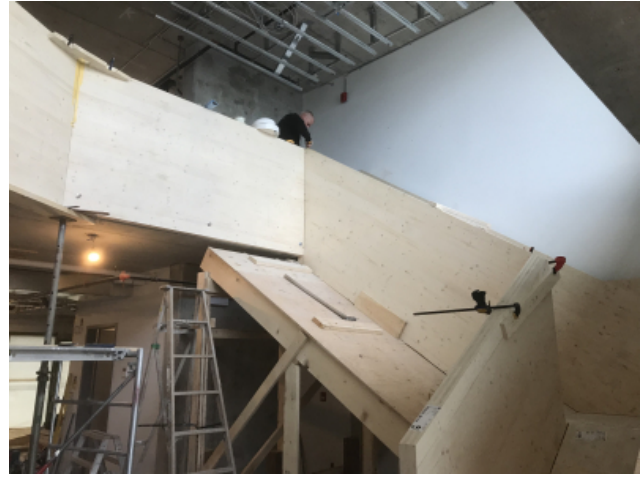
Montage der Treppe mittels Verbindungsmittel und Gerüst