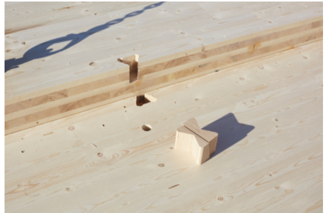
Als Montagehilfe wurden X-Fix eingesetzt.