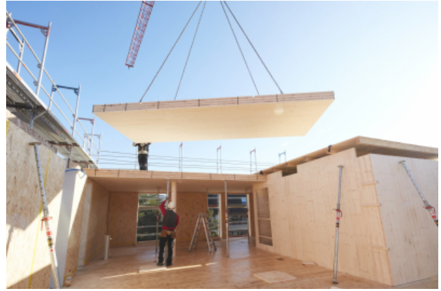
Montage der vorbehandelten CLT-Platten auf den runden Holzstützen.