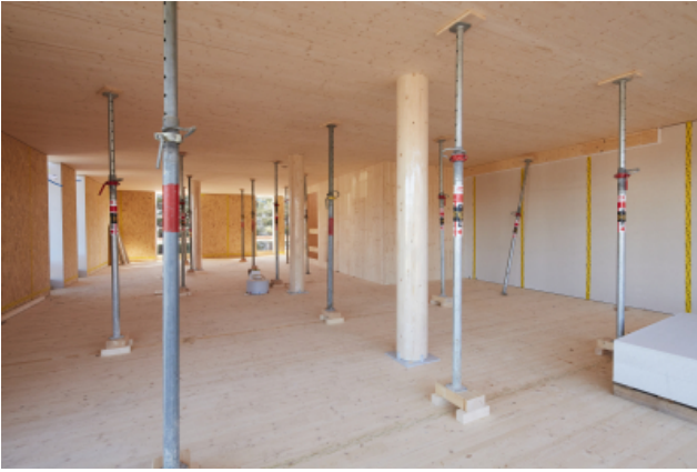
Während dem Aushärten des Gießscharzes müssen die Geschossdecken zusätzlich abgestützt werden.