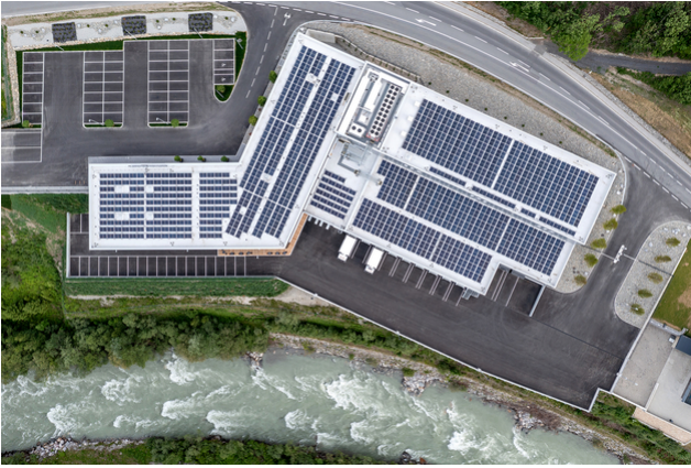
Vogelperspektive des gesamten Gebäudes