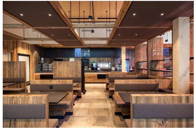
Innenbereich der Gastrostube