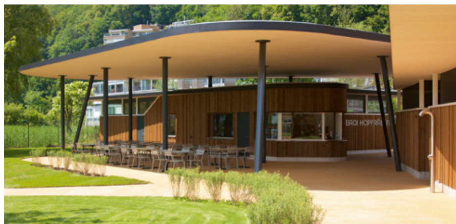
Strandbad Hopfräben – Baujahr: 2021; Ort: Brunnen, CH; TS3-Fläche: 900 m 2 ; Bauherr: Gemeinde Ingenbohl-Brunnen.