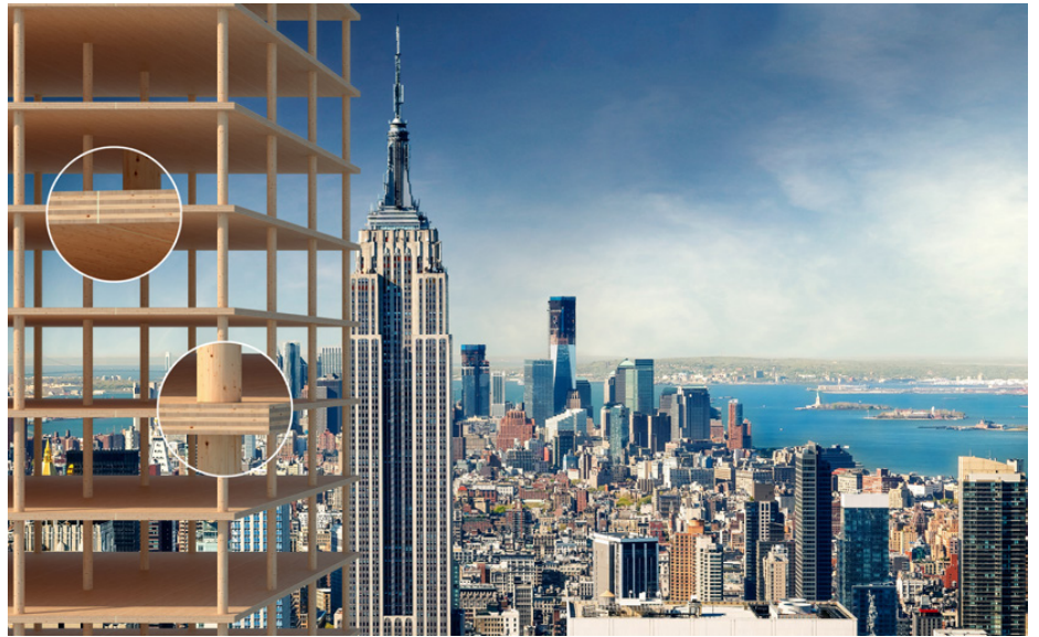
Mit der Entwicklung der Konstruktion TS3 lassen sich auch aus Holz Hochhäuser bauen.

Die Entwicklung einer solchen revolutionären Technologie erforderte enorme Ressourcen, weshalb 2014 die Firma Timber Structures 3.0 AG, kurz TS3 gegründet wurde. Der Firma gelang die Erkenntnisse, dass eine reine Klebeverbindung ausreichend ist, um Stahlbetonkonstruktionen ernsthaft konkurrenzieren zu können.