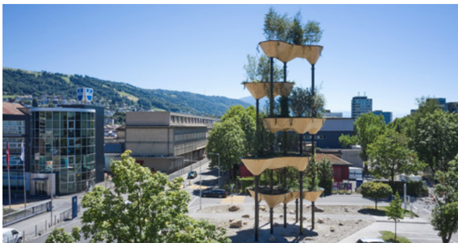
Semiramis – Baujahr: 2021; Ort: Zug, CH; TS3-Fläche: 300 m².

Die TS3-Fuge wird in zwei Arbeitsschritten ausgeführt: Vorbehandeln der Fügeflächen im Werk und Vergiessen der TS3-Fugen auf der Baustelle. Nach dem Abbund der Brettsperrholz-Deckenelemente werden die Fügeflächen im Abbundwerk vorbehandelt. Die Fügeflächen werden mit dem 2K PUR «TS3 PTS PT192» und geeigneten Spachtelwerkzeugen versiegelt. Diese Vorbehandlung erfüllt gleichzeitig mehrere Zwecke. Sie ermöglicht zunächst die Haftung des Giessharzes auf der Holzstirnseite unter optimalen Werksbedingungen. Im Weiteren wird die frische Schnittkante in ihrem für die Verklebung optimalen Zustand konserviert. Zusätzlich werden die Fügeflächen während des Transports zur Baustelle vor äusseren Einflüssen wie z. B. Feuchteveränderungen geschützt. Nach der Vorbehandlung und dem Anbringen von Dicht- und Segmentierungsbänder werden die Elemente für den Transport wasserdicht verpackt. Auf der Baustelle werden die Platten ausgepackt, visuell kontrolliert und mit dem Kran gemäss Verlegeplan an die korrekte Position eingehoben. Die Auflagerung erfolgt auf Wänden, Stützen oder falls erforderlich auf Lehrgerüsten und werden ggf. mit Spriessen unterstützt. Die Oberseite