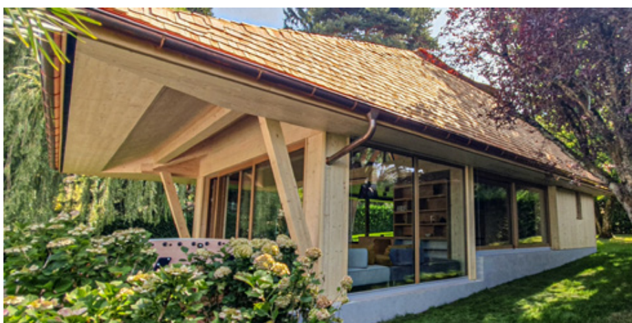
Dach Poolhaus – Baujahr: 2023; Ort: Le Grand-Saconnex, CH; TS3-Fläche: 110 m².

der TS3-Fugen wird mit transparentem Klebeband abgedichtet. Das 2K-PUR-Giessharz wird durch die vorgesehenen Einfüllbohrungen injiziert. Dieses intelligente Ausführungsprinzip gewährleistet eine hohe Qualität und Sicher-