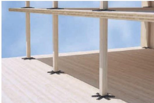
Figur 58 Verbindungs- und Verstärkungssystem Spider für Stützen und Decken

Einige Verbindungsmittelhersteller und Systemanbieter bieten fertige Lösungen für punktgestützte Platten an, die dem Planer die Umsetzung dieser Konstruktionsweise in einigen Sonderfällen erleichtern können.