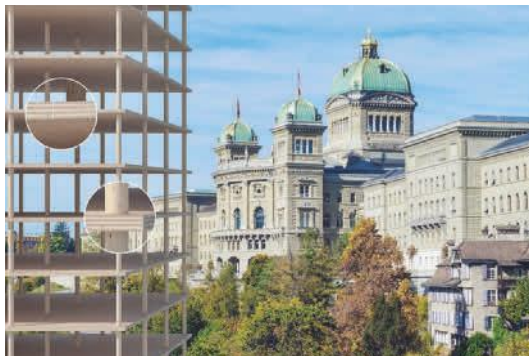
Figur 59 Die TS3-Technologie steht Anwendern in einem Lizenzsystem weltweit zur Verfügung. 2019 entstand das erste Mehr- familienhaus mit dieser Technologie.

Spider von Rothoblaas ist ein Verbindungs- und Verstärkungssystem für Stützen und Decken. Das System ermöglicht mehrstöckige Gebäude mit durchgehenden Strukturen. Zertifiziert, berechnet und optimiert ist es für Stützen aus Brettschichtholz, Furnierschichtholz und Stahlstützen. Der Stahlkern des Systems verhindert ein Querdruckversagen der Brettsperrholzdecken und ermöglicht dadurch die theoretische Übertragung von bis über 5000 kN Kontaktkraft von Stütze zu Stütze. Die Flanken des Systems verhindern das Durchstanzen von CLT-Decken und ermöglichen sehr hohe Querkraftbeanspruchungen. Dadurch ergeben sich mögliche Abstände als Stützenraster bis ca. 7,0 m x 7,0 m.